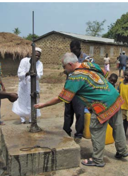
Der Verein Hilfe für Togo e.V. unterstützt mehrere Wasserprojekte in Togo, wie hier einen neuen Brunnen in Katiy.