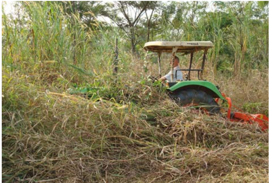
Anton Weber sitzt auch mal selbst auf dem Traktor, hier beim Mulchen einer Aufforstungsfläche.

dorthin, wo sonst niemand hingehet“. Die Hilfsprojekte konzentrieren sich auf ländliche und wenig erschlossene Gegenden.