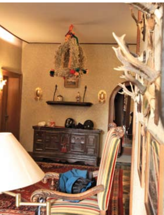
Wie bereits Generationen vor ihnen hängen Schumachers nach der abgeschlossenen Erntesaison eine Erntekrone auf.