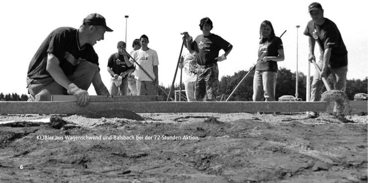
KLJBler aus Wagenschwend und Balsbach bei der 72-Stunden-Aktion.

Drei exemplarische Aktionen bzw. Veranstaltungen aus dem facettenreichen Verbandsleben der Katholischen Landjugendbewegung (KLJB) Freiburg veranschaulichen diese Kennzeichen der Jugendkultur im ländlichen Raum: