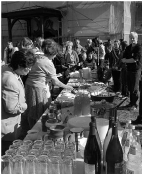
„Ökofairer Brunch“ der KLJB Nordweil vor der Ortskirche.

Dass viele Landjugendliche bereit sind, sich für das Gemeinwohl und ihre Mitmenschen einzusetzen, bewiesen die Mitglieder der KLJB Wagenschwend-Balsbach (Bezirk Mosbach-Buchen) bei der 72-Stunden-Aktion des Bundes der Deutschen Katholischen Jugend (BDKJ). Sie bauten auf dem Gelände des örtlichen Fußballvereins zusammen mit zehn Auszubildenden der Justizvollzugsanstalt Adelsheim ein Beachvolleyball-Feld, eine Grillhütte, eine Kletterwand und eine Außentoilette. Außerdem tauschten sie den Sand im Kindergarten des Dorfes aus und sorgten für die Bewirtung der zahlreichen Zuschauer und Teilnehmer. Damit wurde ein Nutz-