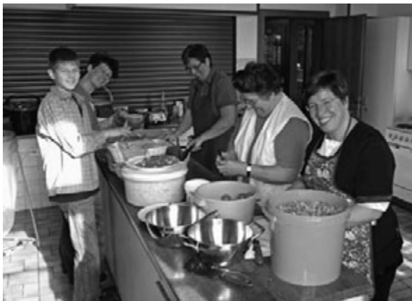
Bäuerinnen im Kreis Buchen kochten ein ansehnliches Mittagessen aus regionalen Produkten zur Erntedankaktion.