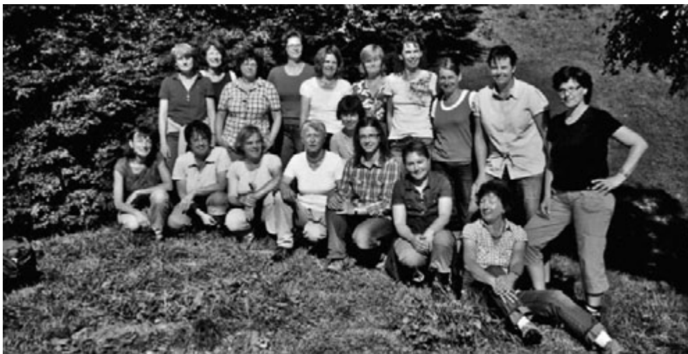
Die Teilnehmerinnen der Sommerauszeit.

Die Teilnehmerinnen der Sommerauszeit in St. Ulrich konnten zu sich kommen, indem sie die Stille der Natur aufsuchten oder sinnliche Erfahrungen mit dem Lehm machten, den sie mit den Händen kneteten und gemeinsam mit ihren Kindern zu Baumgesichtern formten. Zu sich kommen konnten die Frauen auch beim Tanzen und bei der Bibelmeditation am Ende der Freizeit. Da war es schon längst klar: Der eingangs formulierte Wunsch der Frauen konnte eingelöst werden. Manches anfangs noch bleiche und müde Gesicht hatte sich verwandelt, war neu belebt, erfrischt und fröhlich.