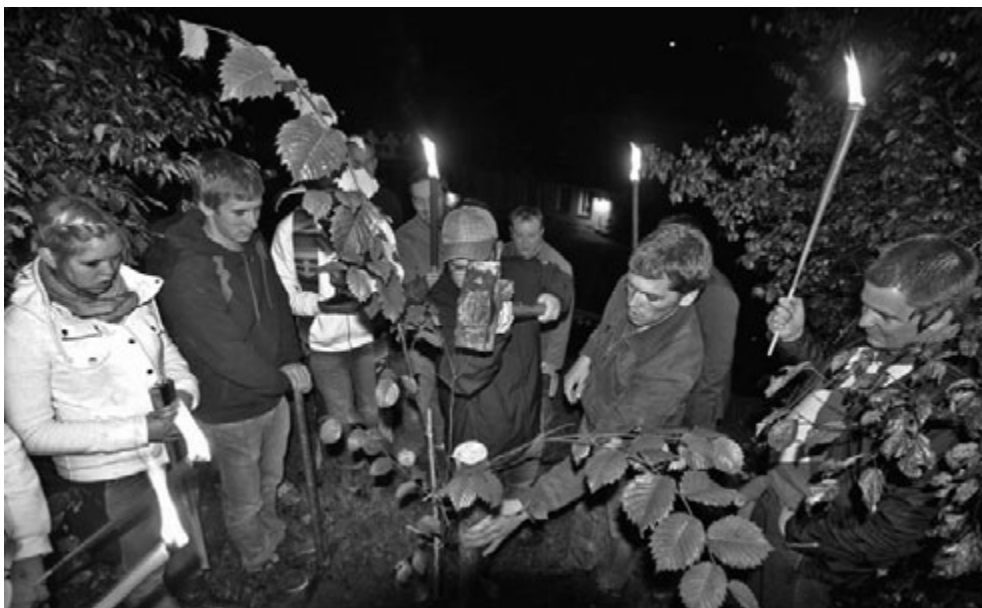
Eine Ulme pflanzten die Mitglieder der KLB anlässlich der Klimaschutz-Kampagne in St. Ulrich.

In der mit 1.250 Teelichtern erleuchteten Kirche Villingendorf wurden meditative Texte gelesen, Gebete und Musik zum Thema Schöpfung vorgetragen. Mittelpunkt war eine mit bunten Tüchern, Pflanzen, Tieren und Lichtern gestaltete Erde nach dem Schöpfungslied der Bibel. Bei nasskaltem Wetter ging es am nächsten Tag nach draußen zu einer Exkursion ins Trockenrasenbiotop „Rauhtal“. Unter Leitung von Mit-