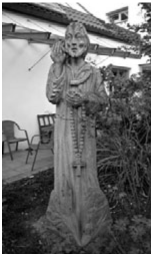
Bruder-Klaus-Statue in der Landvolkshochschule Niederalteich.

Das viertägige Programm konnte unterschiedlichste Erwartungen erfüllen. Im Mittelpunkt standen die altehrwürdigen Donaustädte Regensburg und Passau mit ihren großartigen Domen sowie der Unterkunftsort Niederalteich mit Basilika und Benediktinerkloster und das überaus romantische Krummau, gerühmt als „Perle des Böhmerwaldes“. Durch die noch urwaldartig erhaltenen Hochwäldern des Bayerischen und des Böhmer Waldes ging die Fahrt. In Deggendorf probierten die 48 Teilnehmer genüsslich den Bärwurzschnaps in der ältesten Bärwurzdestille der Welt. Erwähnenswert