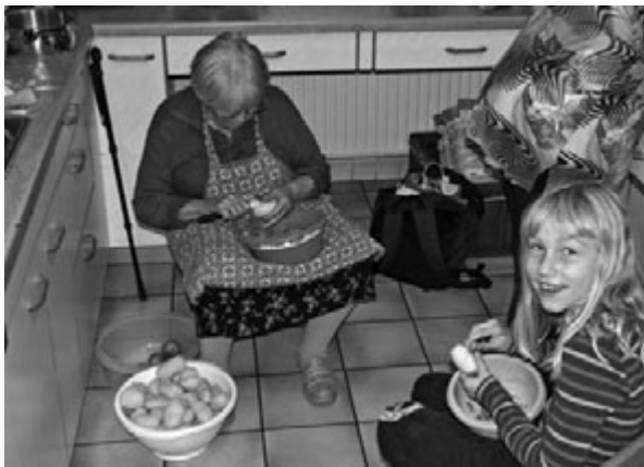
Im Hintergrund wurde viel Vorarbeit geleistet: Jung und Alt schälten bergeweise Kartoffeln.